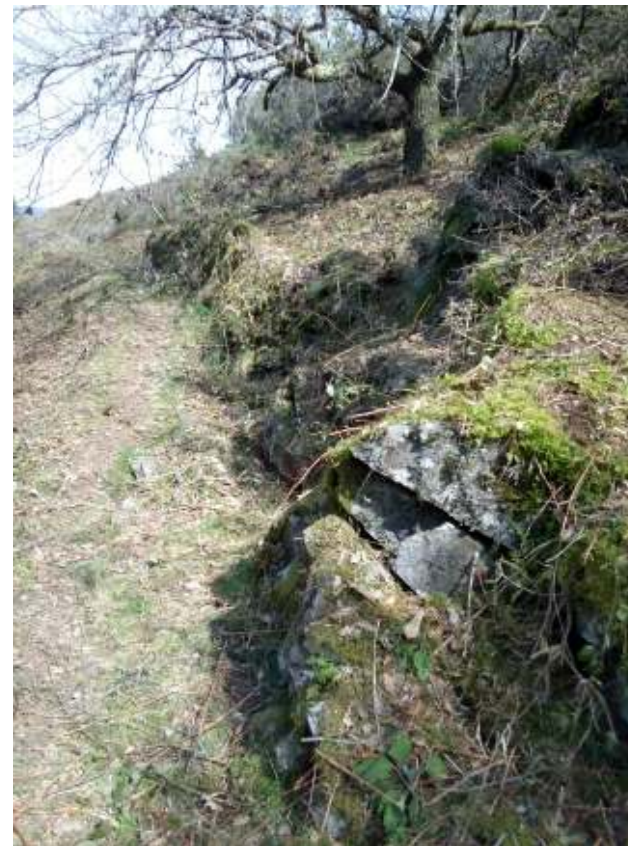
Aldeia do Catarredor