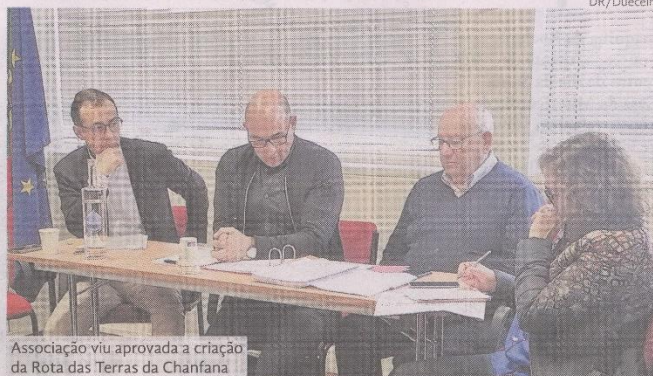
Associação viu aprovada a criação da Rota das Terras da Chanfana

ção da marca, a associação renovou, em 2022, a presença na Bolsa de Turismo de Lisboa e viu aprovada, pelo programa PDR 2020, a criação da Rota das Terras da Chanfana, "consolidada num trabalho de identificação e mapeamento de locais de referência ao nível da cultura e identidade local, sinalização de restaurantes, alojamentos entre outros", lê-se numa nota de imprensa da