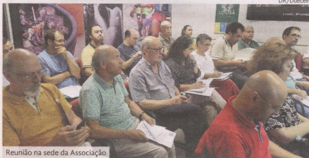
Reunião na sede da Associação

A assembleia-geral da Dueceira, reunida extraordinariamente a 12 de julho com significativa presença de associados, aprovou por unanimidade os documentos de suporte à Estratégia de Desenvolvimento Local (EDL) assim como o acordo de parceria para a sua